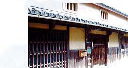
⑩吉村家住宅 (江戸時代、明治) 吉村家は江戸時代に油屋や金融業を営んでおり、今も金融業を営んでいたころの面影が残っています。