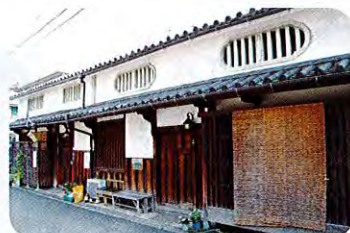
⑫名加 (なか) 家住宅 (江戸時代、明治) 名加家は、大正頃まで木櫛の卸問屋業を営んでいました。二棟の家屋が違和感なく統一されています。