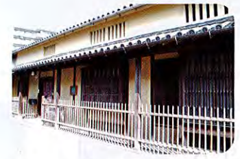
②並河 (なみかわ) 家住宅 (江戸時代) 並河家は代々ト半家の重臣で、近代には貝塚町や泉南郡役所の役人を務めており、式台が今も残っています。