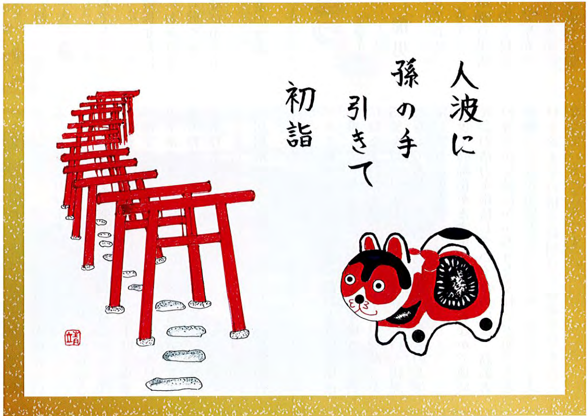
『俳画』 会員 前窪 靖弘 作

第 49 号 発行所 公益社団法人 貝塚市シルバー人材センター 住所 〒597-0083 貝塚市海塚1丁目17番20号 電話 072-432-3620 FAX 072-436-3957