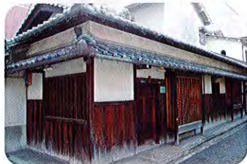
⑨竹本家住宅 (西町) (江戸時代) 竹本家は当初の住人の職業は不明ですが、ト半家家来の屋敷であった可能性があります。