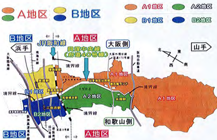
貝塚市内住居区域；収集地区割り、ごみ収集日について

末筆になりましたが、シルバー人材センターと会員の皆様方の益々のご発展とご健勝をご祈念申し上げます。