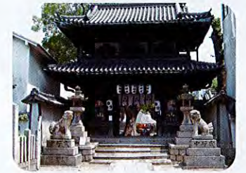
①感田神社 (江戸時代、明治、昭和) 感田神社は伝統的な様式で建築された建造物群がまとまってあり、統一性のある境内の景観が形成されています。