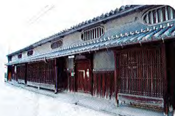
⑪廣海 (ひろみ) 家住宅 (江戸時代、大正) 廣海家は江戸時代に穀物や肥料を取り扱う廻船問屋を営み、一街区 (いちがいく) を占める敷地を誇ります。