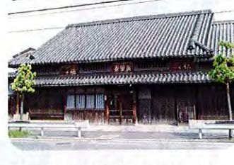
⑦宇野家住宅 (江戸時代、大正) 宇野家は江戸時代以来、鋳物 (いもの) 業を営み、ト半家の狂言方も務めた旧家です。