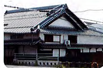
⑧尾食 (おわし) 家住宅 (江戸時代) 尾食家は江戸時代に旅籠 (はたご) 屋や金融業を営み、明治時代には干鰯 (ほしか) 屋や木綿仲買などを営んでいました。