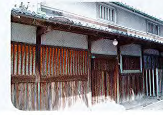
⑤利齋 (りさい) 家住宅 (江戸時代、昭和初期) 利齋家は江戸時代に薬種問屋を営んでおり、18世紀前半に遡る家です。