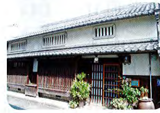
⑥岡本家住宅 (江戸時代、明治) 岡本家は江戸時代に醤油製造業を営み、寺内町の年寄役も務めました。