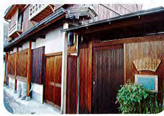
⑬南川家住宅 (昭和、明治初期) 南川家住宅は当地域の近代初頭から昭和初期までの住宅の様子が窺える貴重な建物といえます。