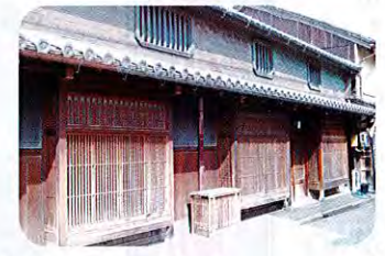
③山田家住宅 (江戸時代) 山田家はもとト半家の家来で江戸時代からは古美術商を営んでいました。すり上げ大戸が特徴的です。