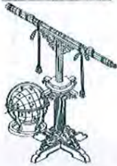
善兵衛が初めて作った望遠鏡