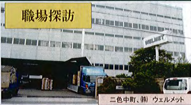
二色中町、(株) ウェルメット