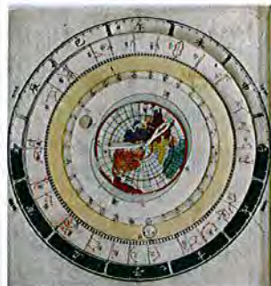
星座早見盤 (平天儀)