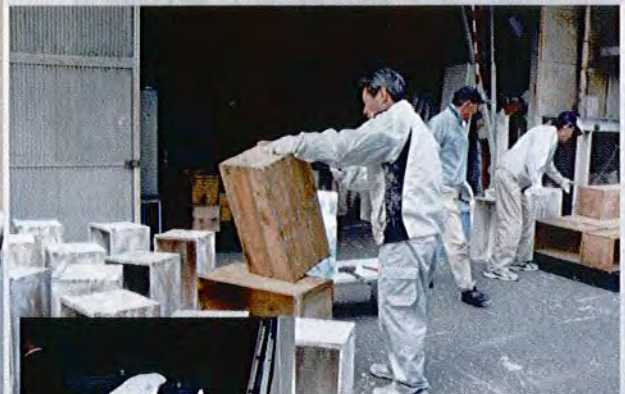
各店舗の装飾品梱包。木箱や机等のペンキ塗りが多い時は日に40箱位塗装する。