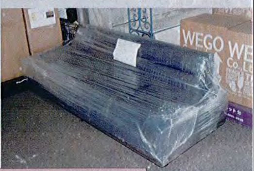
大きい梱包の品物