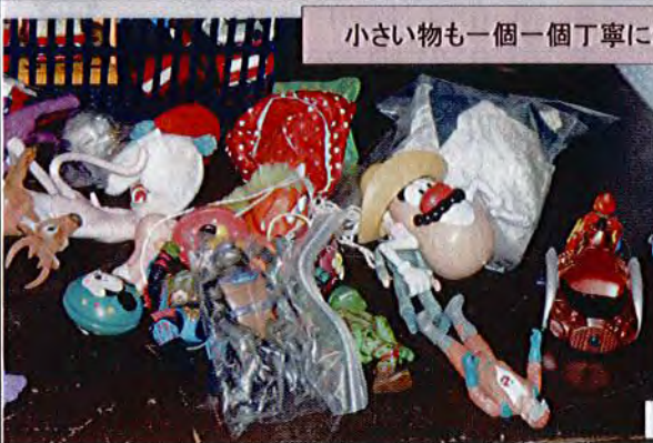
小さい物も一個一個丁寧に包む