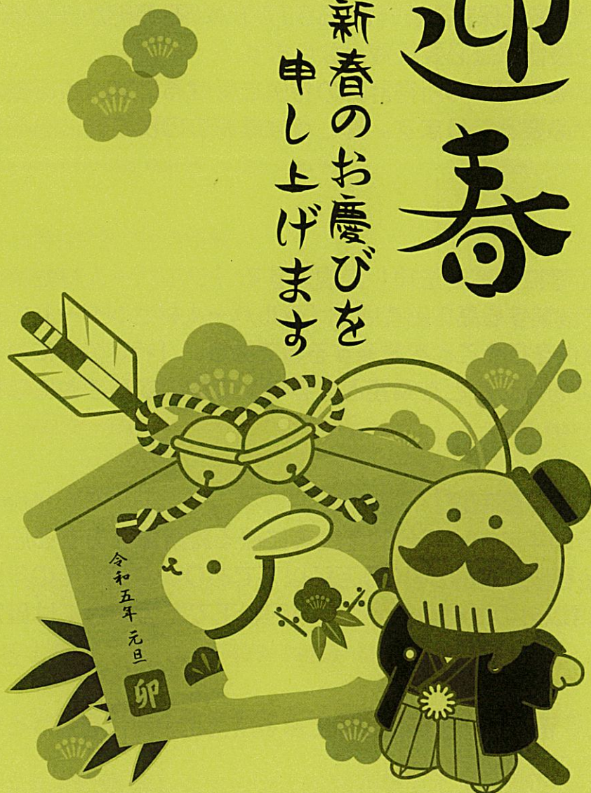
貝塚市イメージキャラクター つげさん

ご健康に留意され、安全に心がけ、今年こそ、事故 ゼロを目指して、楽しく頑張っていきましょう。