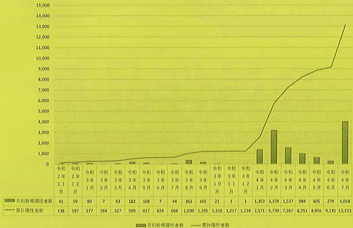
貝塚市内の月別陽性者数の推移

府民の皆様へ（特措法第24条第9項に基づく） 2022.8.15